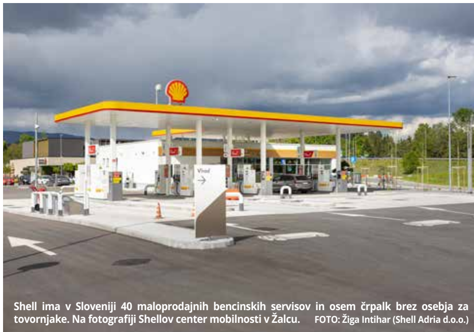
Shell ima v Sloveniji 40 maloprodajnih bencinskih servisov in osem črpalk brez osebja za tovornjake. Na fotografiji Shellov center mobilnosti v Žalcu.